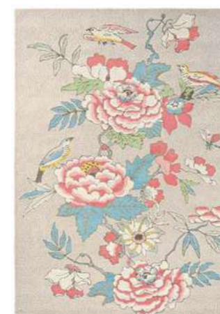
Paeonia coral 37902

Рaeonia - это ботаническое название пионов. Будучи историческим памятником, датируемым тысячелетиями, пион известен как источник богатства и чести. Оригинальные дизайны для создания этой коллекции взяты из первой серии образцов 18-го века. Созданный в стиле шинуазри, популяризированном в восемнадцатом и девятнадцатом веках благодаря одержимости Востоком, этот стиль представляет собой царство гигантских цветов, крошечных деревьев, храмов, пагод, необычных птиц и других природных мотивов.