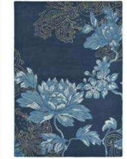
Fabled Floral navy 37508