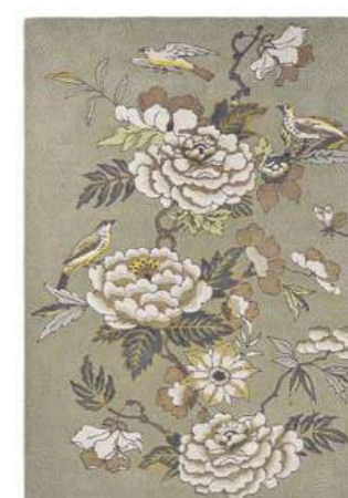
Paeonia taupe 37904