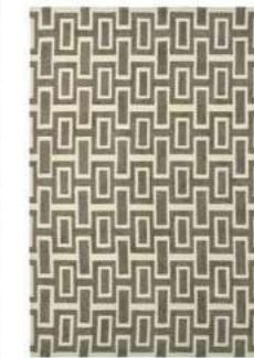
Intaglio grey 37201