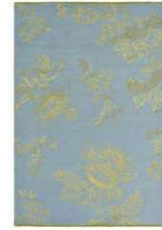
Tonquin blue 37008