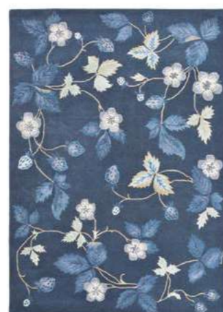
Wild Strawberry navy 38118