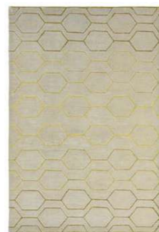
Arris grey 37304