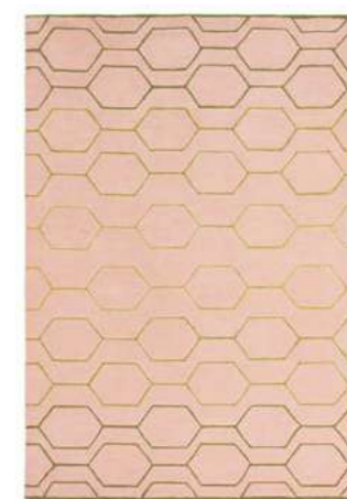
Arris pink 37302