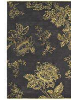
Tonquin charcoal 37005