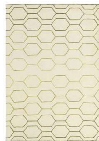
Arris cream 37309

Arris - это свежая, неожиданная коллекция, вдохновленная историческими текстурами и формами из архива Уэджвуда. Коллекция представляет собой модные и стильные продукты, идеально подходящие для современной экспрессивной жизни. Шикарные и утонченные предметы интерьера и посуда станут украшением дома путешественников, увлеченных дизайном и креативных молодых специалистов.