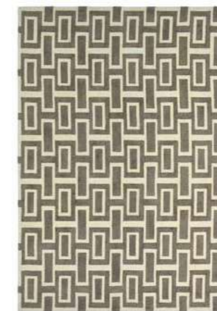
Intaglio grey 37201

Современность встречает классику с рисунком Intaglio, который сочетает в себе несколько рельефных текстур, популярных в эпоху грузин, в современный и стильный дизайн. Тактильный керамический рисунок черпает вдохновение из ремесленной техники накатки, впервые примененной Джозайя Уэджвудом в 18-м веке.