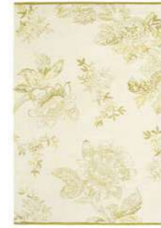
Tonquin cream 37009