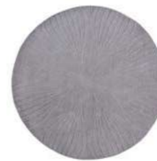
Folia round grey 38305