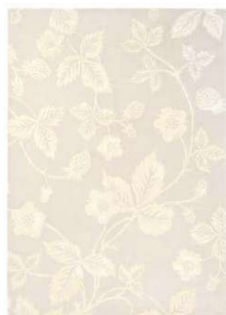
Wild Strawberry tonal 38201

Знаменитая коллекция Wild Strawberry является сердцем Wedgwood, и ее популярность делает этот ассортимент бестселлером во всем мире уже более 50 лет. Очарование тонко нарисованных листьев, цветов и сочной красной клубники остается неизменным в новых изделиях, изготовленных в Англии с использованием традиционного мастерства Wedgwood.