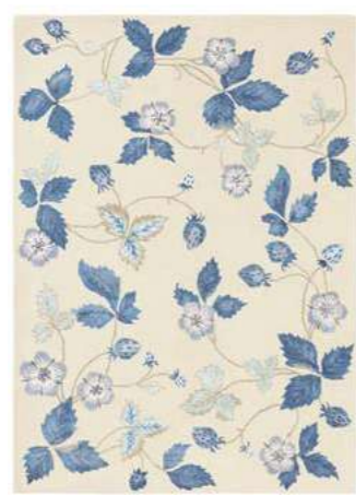
Wild Strawberry cream 38108