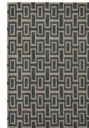
Intaglio black 37205