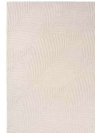
Folia stone 38301

Коллекция White Folia навеяна красивыми природными формами природы, идеально заключенными в шелковисто-белый фарфор. Эта коллекция включает в себя индивидуальные узоры и мотивы, уникальные для каждого предмета. Это позволяет вам создать свою собственную коллекцию на заказ. Органические формы и тонкий перламутровый рисунок прекрасно сочетаются с цветочными мотивами.