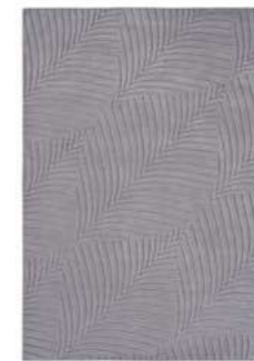
Folia grey 38305