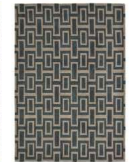
Intaglio black 37205