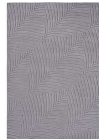
Folia grey 38305