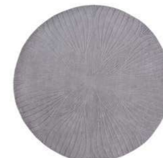
Folia grey round 38305