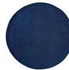
Folia round navy 38308