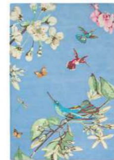
Hummingbird blue 37808