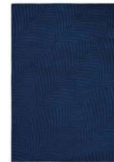
Folia navy 38308