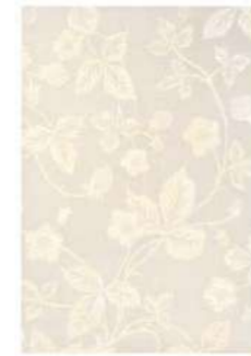
Wild Strawberry tonal 38201