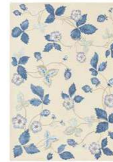
Wild Strawberry cream 38108