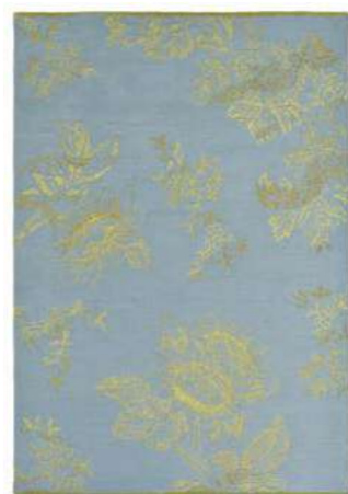
Tonquin blue 37008