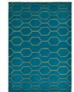
Arris teal 37307