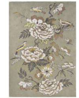
Paeonia taupe 37904