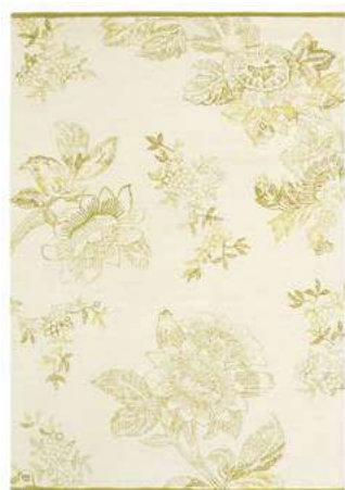
Tonquin cream 37009

Изначально Tonquin изготавливался на черной яшме с использованием техники энкаустики, которая требовала высоких навыков. Дизайн Tonquin, смелый и амбициозный, отражает естественные темы, которые были популярны в начале 19-го века.