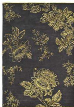
Tonquin charcoal 37005