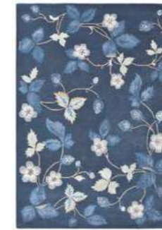
Wild Strawberry navy 38118