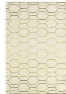
Arris cream 37309