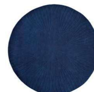
Folia navy round 38308