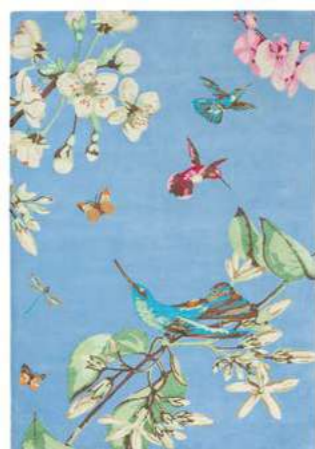
Hummingbird blue 37808

Произведенная в Англии и расписанная вручную опытными мастерами Wedgwood, эта коллекция сочетает в себе изысканные рисунки колибри с яркими ботаническими пейзажами ярких оттенков, в которых воплощено вдохновение природы и отражение ее красоты в доме. Колибри, эти очаровательные миниатюрные чудеса природы, символизируют радость и игривость в этой великолепно созданной престижной коллекции. Тщательно расписанные вручную детали из эмали прославляют богатое наследие и опыт Wedgwood, а чарующие цвета и дизайн делают эту посуду по-настоящему роскошной и ценной.