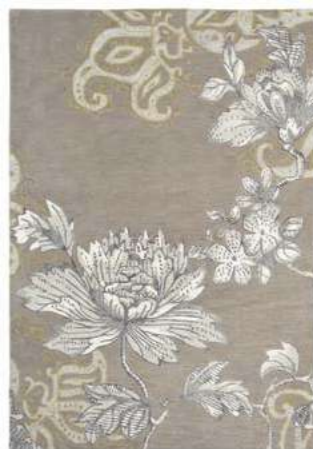
Fabled Floral grey 37504

Fabled Floral черпает вдохновение из оригинального паттерна Fabled Crane и использует характерный мотив пиона для создания нежного цветочного мотива. Дизайн был вдохновлен экзотическим паттерном фазана приблизительно 1820 года, когда мода на Восток была в самом разгаре.