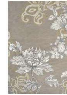
Fabled Floral grey 37504