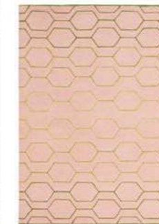
Arris pink 37302