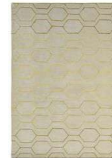
Arris grey 37304