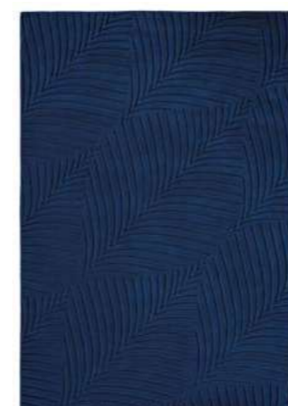
Folia navy 38308