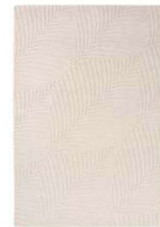
Folia stone 38301