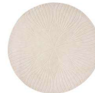
Folia stone round 38301