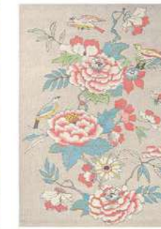
Paeonia coral 37902