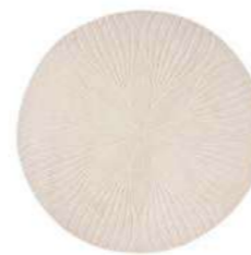
Folia round stone 38301