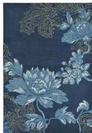
Fabled Floral navy 37508